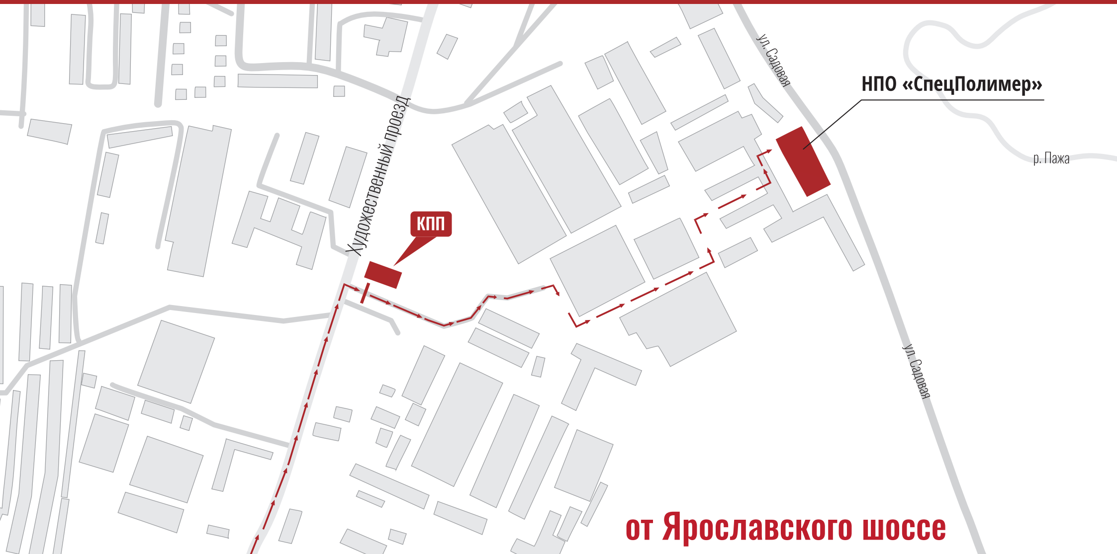
Схема проезда до логистического центра НПО «СпецПолимер»